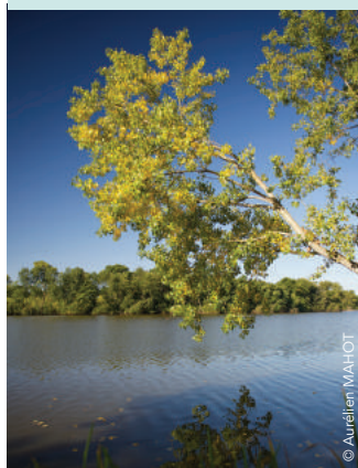
Étang de la Thévinère Gesté | BEAUPRÉAU-EN-MAUGES

En cas de déménagement, compléter le formulaire de déménagement disponible sur www.servicedechets. maugescommunaute.fr ou contacter le service au 02 41 71 77 55 .