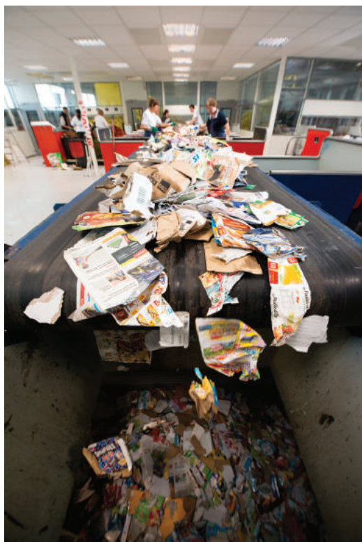
Centre de tri des emballages ménagers Saint-Laurent-des-Autels | ORÉE-D'ANJOU